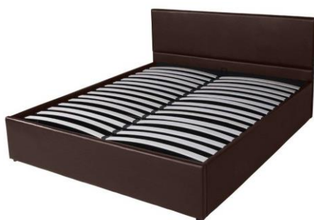
Zdjęcie stelaża w łóżku, w którym go użytkujesz