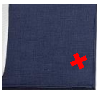
Zdjęcie usterki nr 1