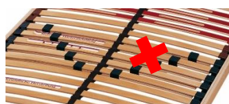
Zdjęcie usterki nr 2