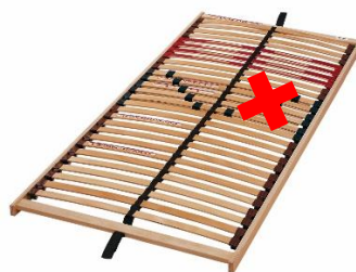
Zdjęcie z zaznaczonym miejscem usterki