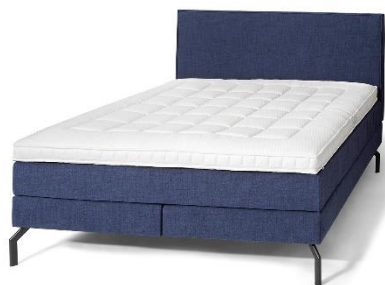
Zdjęcie całego łóżka