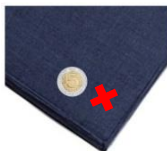
Zdjęcie usterki nr 2 (opcjonalnie z monetą dla pokazania wielkości usterki)